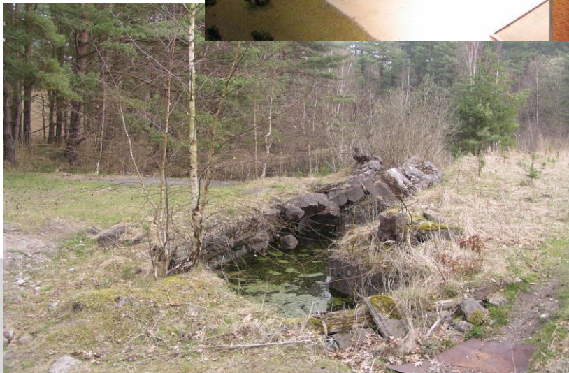
heutiger Zustand 2014